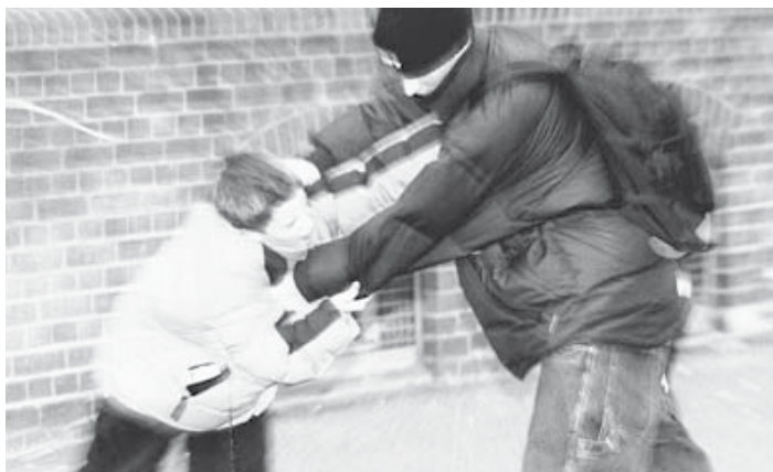
Schlägereien auf dem Schulhof gehören für einige Jugendliche zum Alltag.

„Die Häufigkeit der Fälle hat sich nicht verändert, aber die Brutalität hat zugenommen“, sagt Waschlewski mit Blick auf die 25 Klienten, die bei „Komm an“ im ersten Halbjahr 2007 betreut wurden: Zehn Jungen im Alter von neun bis 17 Jahren waren wegen körperlicher Gewalt in Therapie, zwölf wegen sexualisierter Gewalt. Auch erwachsene Männer wurden betreut: Zwei wegen sexualisierter Gewalt, ein weiterer, weil er innerhalb seiner Familie gewalttätig geworden war.